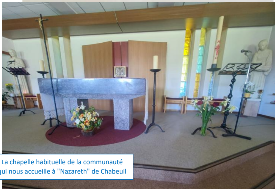
La chapelle habituelle de la communauté qui nous accueille à "Nazareth" de Chabeuil