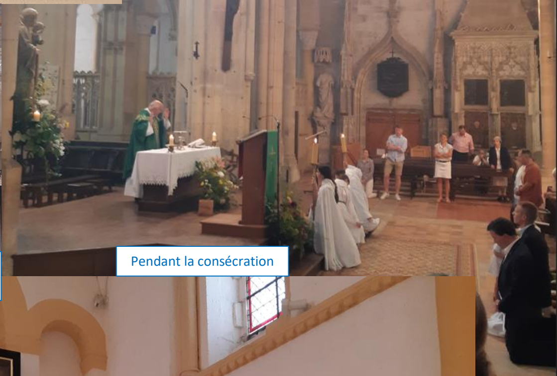
Pendant la consécration