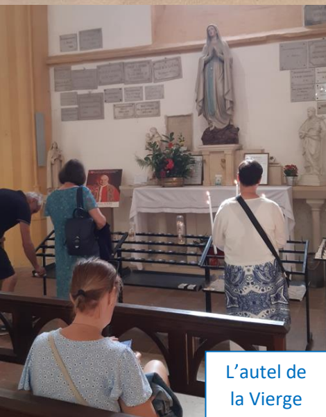
L'autel de la Vierge

T'es-tu déjà réconcilié avec un copain ? Comment cela s'est-il passé ? Comment faites-vous pour faire la paix ? Sur un cœur en papier, écris les prénoms de ceux que tu confies à Jésus pour qu'ils se réconcilient. Dépose-le dans ton coin prière.