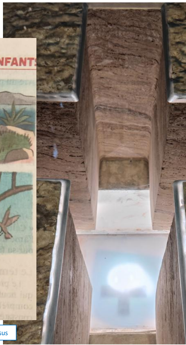
L'autel vu du dessous