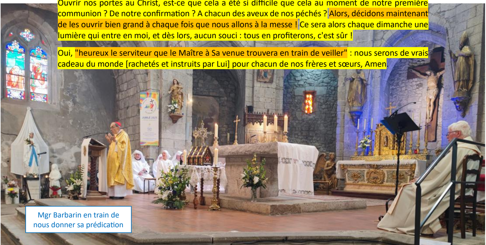
Mgr Barbarin en train de nous donner sa prédication

Oui, "heureux le serviteur que le Maître à Sa venue trouvera en train de veiller" : nous serons de vrais cadeau du monde [rachetés et instruits par Lui] pour chacun de nos frères et sœurs, Amen.